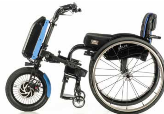
Empulse F55 para cadeira com apoios de pés fixos

Com estruturas de encaixe e de condução mais compridas (e curvadas) para se adaptarem melhor às cadeiras com apoios de pés desmontáveis, proporcionando uma condução ergonómica e confortável.