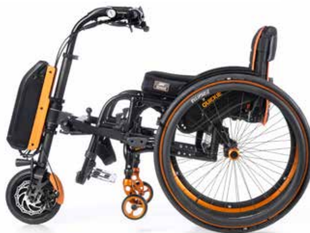
Empulse F55 para cadeira com apoios de pés removíveis

... de viver as mais incríveis aventuras ao ar livre. Com um sistema de ancoragem simples, a handbike elétrica Empulse F55 pode acoplar-se a qualquer tipo de cadeira de rodas numa questão de segundos, convertendo-a no complemento mais poderoso para o seu dia a dia.