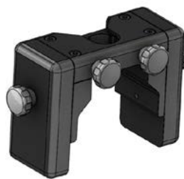
// EMF090181 Contrapeso desmontável