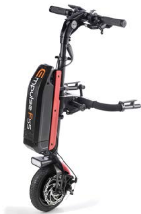
// EMF070085 Empulse F55 com roda maciça de 8,5" (Mostrada com a conexão para cadeiras com apoios de pés fixos ref. EMF010027 e kit de cor em vermelho)