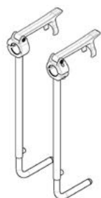
// EMF010032 Suporte de pé (cavelete)