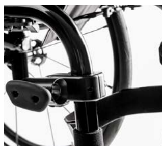
// EMF010029 Abraçadeiras para cadeiras com tubos redondos (ajustáveis a tubos de 19.5 / 23 / 25 / 28.6 e 30 mm)