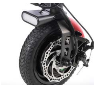
Luz dianteira LED, guardalamas em vermelho e travão de disco (mostrada com roda maciça de 8,5")