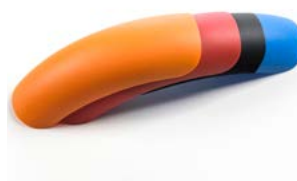
Kit de 4 cores para o guardalamas (incluídos de série)