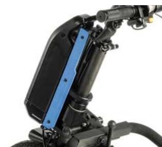
Kit de 4 cores para os laterais (incluídos de série)