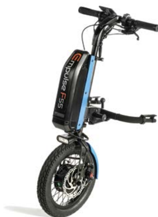
// EMF070086 Empulse F55 com roda pneumática de 14" (Mostrada com conexão para cadeiras com apoios de pés fixos ref. EMF010027 e kit de cor azul)