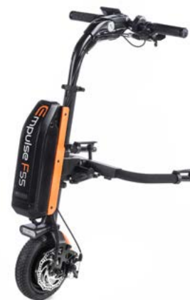
// EMF070085 Empulse F55 com roda maciça de 8,5" (Mostrada com conexão para cadeiras com apoios de pés desmontáveis ref. EMF010028 e kit de cor laranja)