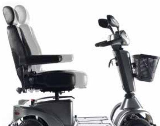
→ Assento deslizante, ajustável em profundidade

Desde o assento até à base, todos os elementos das scooters eléctricas Sterling Serie-S foram exclusivamente desenhados para lhe proporcionar um grande conforto. O assento é ajustável em altura, ângulo e profundidade e os apoios de braços podem-se ajustar em largura, ângulo e profundidade ou reclinar totalmente para facilitar o acesso. Eleve o conforto ao mais alto nível com as novas scooters Serie-S!