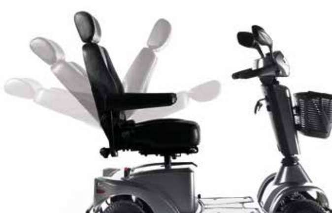
→ Ajuste simples do ângulo do encosto