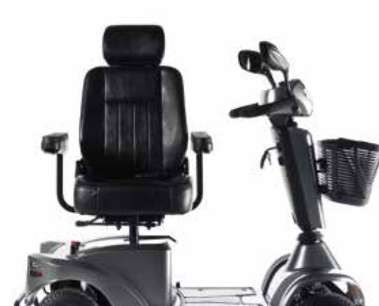
→ Assento giratório que facilita as transferências