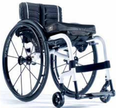
XENON 2 Apoio de pés fixos A MAIS LEVE