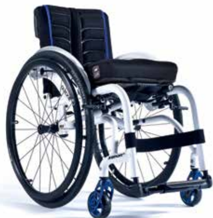
XENON 2 Estrutura híbrida A MAIS RESISTENTE