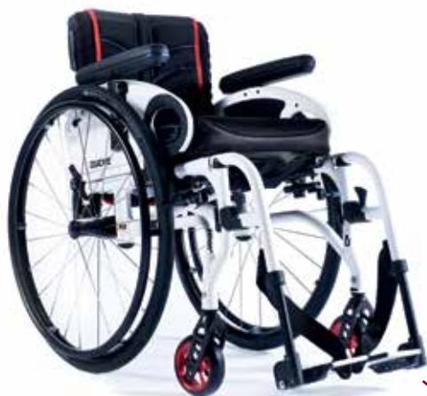
XENON 2 Apoio de pés Desmontáveis A VIAJANTE