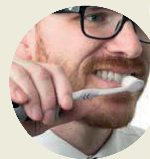
ADAPTADOR UNIVERSAL con estructura magnetizada útil para la aceptación de diferentes objetos (cepillo de dientes, maquinilla de afeitarse, pluma, etc.)