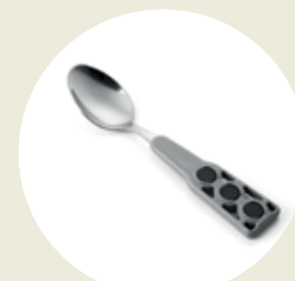
Cucharas (cod. TT-03)