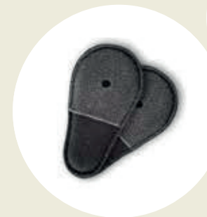
RELLENO para buen agarre del elemento