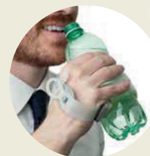
ADAPTADOR para botella o vaso con estructura magnetizada