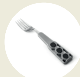
Tenedor (cod. TT-02)