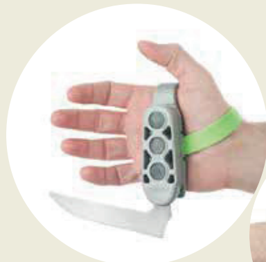
CUCHILLO con mango magnetizado