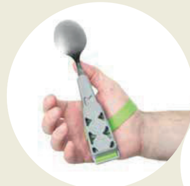
CUCHARA con mango magnetizado