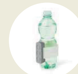
Adaptador de botella / vidrio disponible bajo pedido (cod. TT-06)