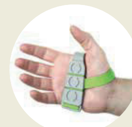
Elemento de agarre (cod. TT-01)

El sistema Tactee consta de los siguientes elementos.