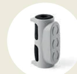
Adaptador universal (cod. TT-05)