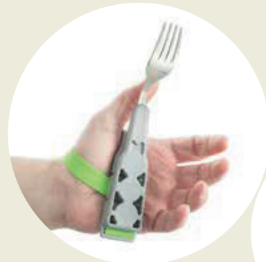
TENEDOR con mango magnetizado