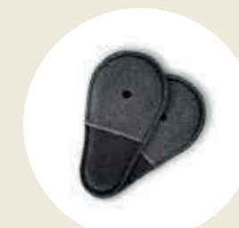
Relleno para elemento de agarre (cod. TT-07)