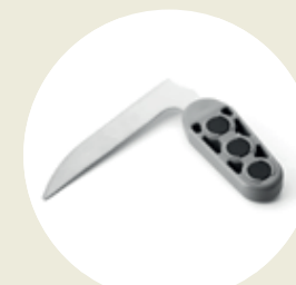
Cuchillo (cod. TT-04)