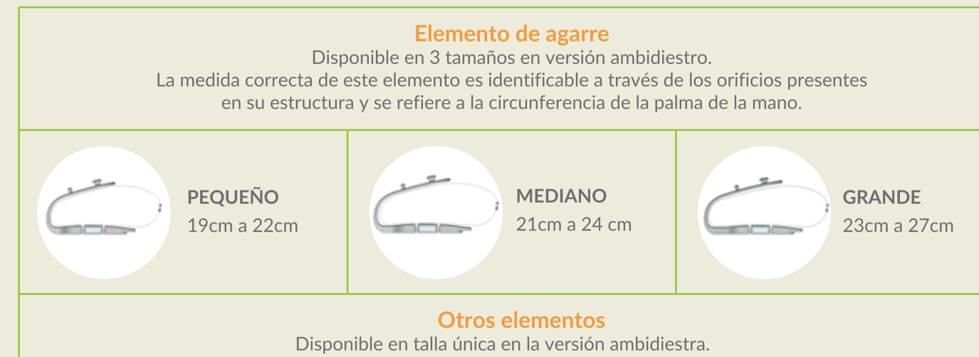
Tabla de medidas

El dispositivo se adapta al usuario y no al revés gracias a un diseño ergonómico que permite un "ajuste" perfecto e inmediato en la mano de quien lo lleva.